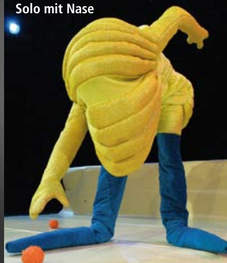
Solo mit Nase