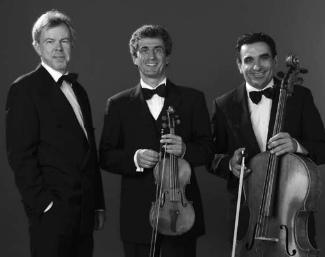
Trio Opus 8