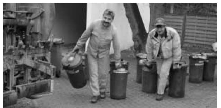
Bis zu 1.000 Rundtonnen, manche noch aus Metall, muss jeder Müllwerker täglich zum Auto schleppen, einhängen und leeren. Mit fahrbaren Behältern geht dies schneller und einfacher.

sowie weniger Tonnen zum raus- und zurückstellen. Außerdem reduziert sich die Zahl der Leerungen und damit