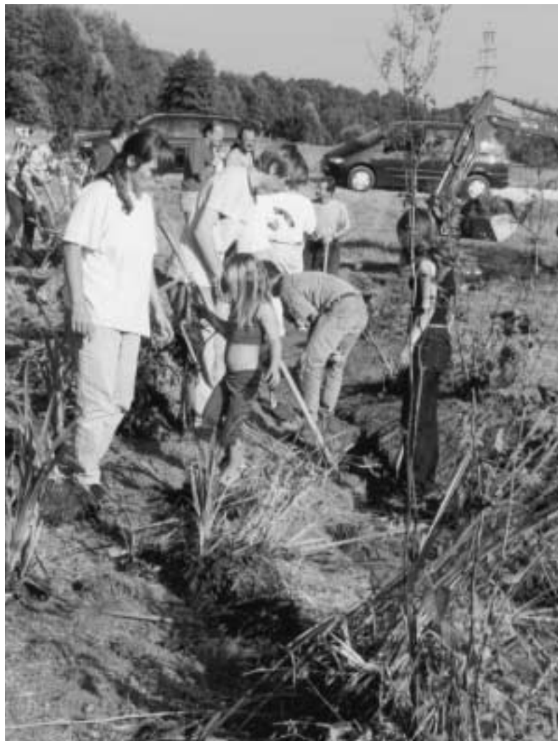
Geburtstagsgeschenk für den Landschaftspflegeverband: In einer Gemeinschaftsaktion mit Bund Naturschutz, Tiefbauamt und vielen freiwilligen Helfern wurde im vergangenen September der Mittelbach wieder instandgesetzt. Damit wieder Wasser fließen konnte, mussten 100 Meter Bach neu gebaut werden.

Nähere Informationen erhalten Sie in der Geschäftsstelle bei Andreas Barthel, Albrecht-Achilles-Straße 6-8, Telefon 09122/860 340.