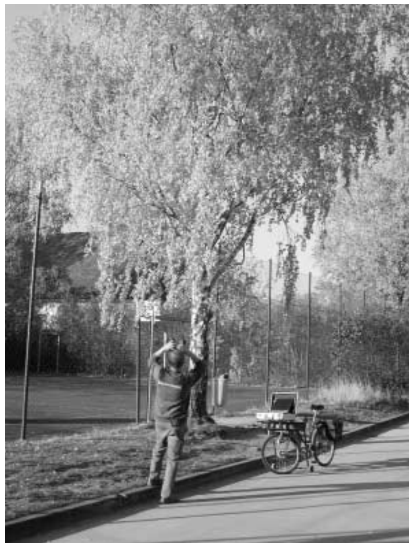
Ein städtischer „Grüner“ bei der Arbeit.

Von den etwa 400 Bäumen (Tendenz steigend), die jährlich im Zuge der Baumschutzverordnung von den entsprechend ausgebildeten Mitarbeitern der Stadtgärtnerei begutachtet werden, dürfen übrigens nur etwa zehn Prozent nicht gefällt werden. Das heißt, der Eingriff in die persönliche Entscheidungsfreiheit des Gartenbesitzers ist tatsächlich viel geringer als gemeinhin angenommen. Gerne wird auch das Angebot wahrgenommen, sich in diesem Zusammenhang unentgeltlich vor Ort über die Standfestigkeit von Bäumen, das Nachbarschaftsrecht oder über allgemeine Fragen zur Gartengestaltung beraten zu lassen - ein nicht gerade üblicher Service, den die Stadt Schwabach ihren Bürgern bietet.