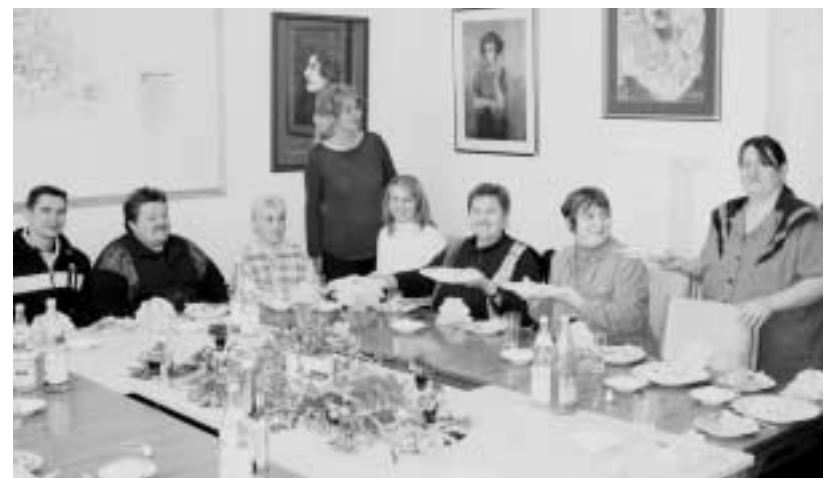
Mit einem gemeinsamen Essen endete der erfolgreich verlaufene Kurs „Arbeit statt Sozialhilfe“ im Schwabacher Stadteilladen „Brückla“.