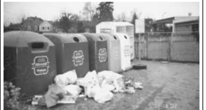
Auch gegen solche unerlaubten Ablagerungen neben Glas- und Metallglus soll 2004 verstärkt vorgegangen werden.

Durch laufende, kurze Berichterstattung in der örtlichen Presse über Erfolge bei der Verfolgung von Ordnungswidrigkeiten soll eine abschreckende Wirkung erzielt werden. Ziele sind vor allem, die Eigenverantwortung der Bürger zu stärken und eine Mithilfe bei der Verfolgung unerlaubter Abfallablagerungen zu erreichen.