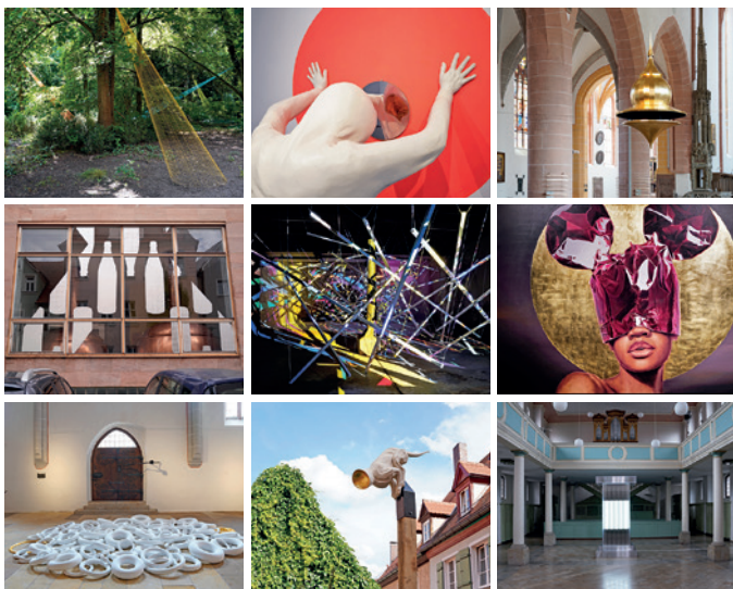
Impressionen von ortung 12