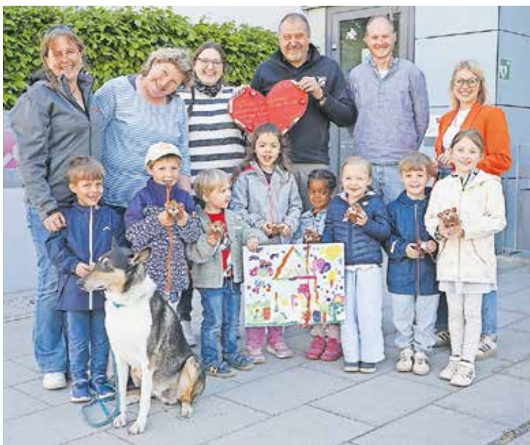
Die Kinder der Kita „Hoppetosse“ zu Besuch bei der GEWOBAU

S üßen Besuch erhielt die GEWOBAU kürzlich von einer Gruppe der Johanniter-Kindertagesstätte „Hoppetosse“ – begleitet von einem tierischen