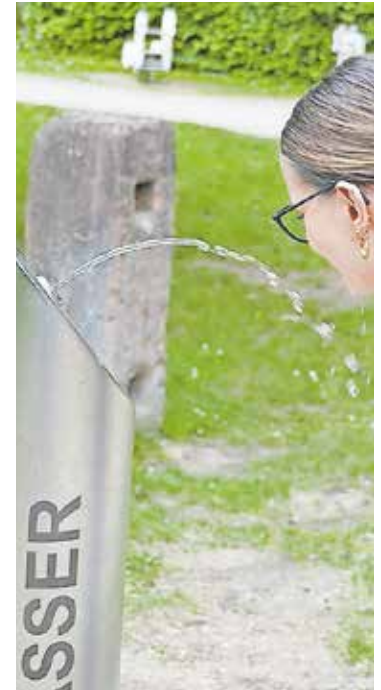
Kühles Nass für heiße Tage gibt es zum Beispiel im Apothekergarten

Die Karte soll stetig erweitert und aktuell gehalten werden. Deshalb bittet die Stadt um Mithilfe: wer geeignete Plätze kennt, die noch nicht auf der Karte verzeichnet sind, kann sich gerne melden unter E-Mail mobiltaet-klimaschutz@schwabach.de