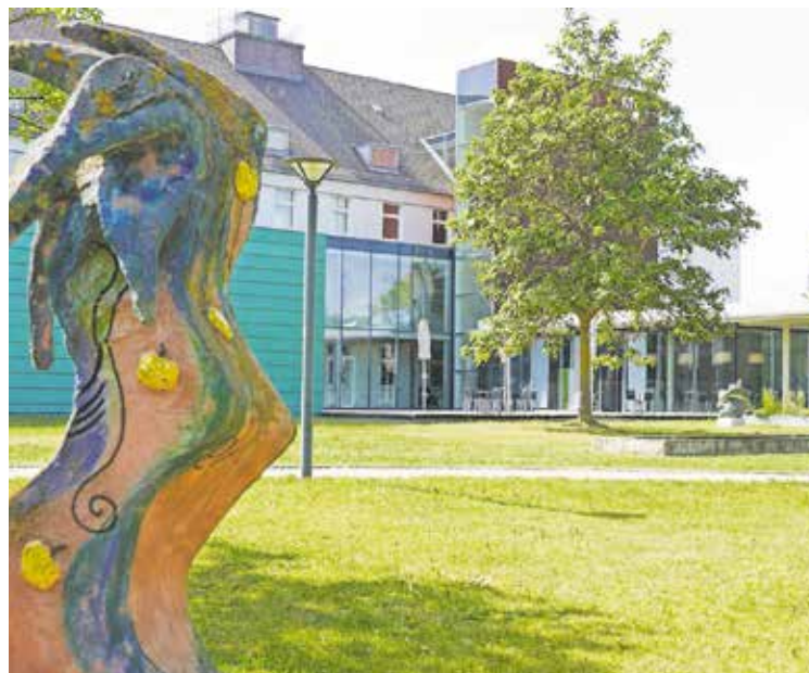
Der Museumspark ist die ideale Kulisse für das Konzert

Gemeinsames Tafeln ist erwünscht, es dürfen Picknickdecken und Speisen mitgebracht werden. In der Cafeteria des Museums gibt es Getränke. Auch einige Biertischgarnituren stehen bereit zum gemeinsamen Tafeln. Sollte es regnen, wird