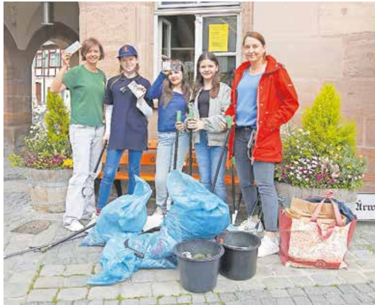
Drei der 18 Jugendlichen und ihre Lehrerinnen standen für ein Foto zur Verfügung.

Die Menge an Abfall überraschte sie: Neben zahlreichen Zigarettentümmeln wurden auch Vapes, Flaschen, Verpackun-