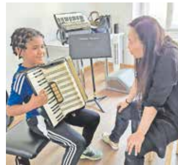
Ein Kind testet das Akkordeon.

Auch im Fach Posaune wird es ab dem kommenden Schul-