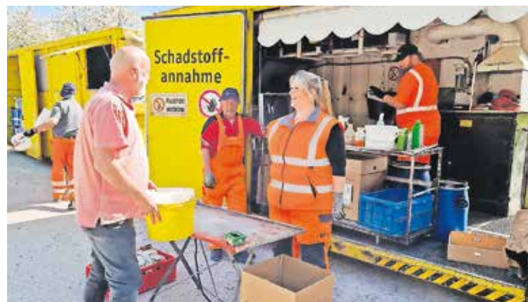
Die Beschäftigten am Umweltmobil kennen sich mit Schadstoffen aus.

G iftige und umweltschädliche Abfälle sammelt die Stadt am Samstag, 20. Juni, kostenlos ein. Am Schadstoffmobil werden Sondermüll aus Schwabacher Privathaushalten sowie vergleichbare Abfälle aus Schwabacher Gewerbe- und Dienstleistungsbetrieben in haushaltsüblichen Kleinmengen angenommen. Es können zum Beispiel Desinfektionsmittel, stark wirkende Reinigungsmittel wie Felgenreiniger oder Rohrreiniger, flüssige Klebstoffe