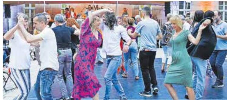
Ritmos Latinos im atmosphärischen Innenhof des Alten DG

Am Samstag darauf wollen Mercadonegro die Bühne zum