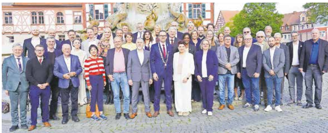
Das Stadtratsgremium vor dem Schönen Brunnen im Anschluss an die konstituierende Sitzung

Oberbürgermeister Reiß vereidigt neue Mitglieder