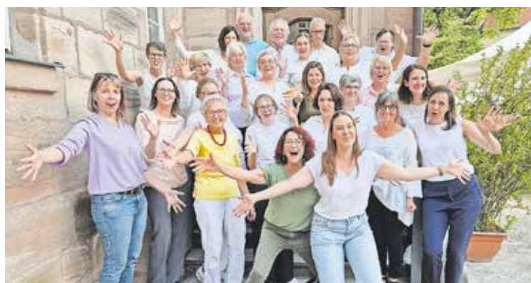
Der Feierabendchor der Adolph von Henselt-Musikschule

Zu einer Chormatinee laden die NaturFreunde Nürnberg-Eibach am Sonntag, 14. Juni, auf ihre Vereinswiese in der Castellstraße 99 ein. Zu hören sein wird dabei auch der „Feierabendchor“ der Adolph von Henselt-Musikschule Schwabach, neben dem Chor „die stimmen“ der Musikschule Ansbach. Die Matinee beginnt um 11 Uhr, Einlass ist ab 10:30 Uhr. Besucher dürfen Picknickdecken mitbringen oder auf