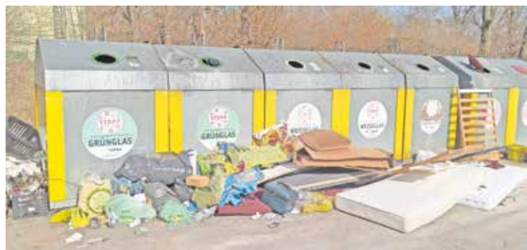
Nur eines von zahlreichen Beispielen für die Vermüllung an Containern

Meldungen konsequent nach, ist aber auf Mithilfe der Bürgerschaft angewiesen. Es ist grundsätzlich möglich, dies online zu tun über den Mängelmelder auf www.schwabach.de/maengelmelder . Das Umweltschutzamt kann unter Telefon 09122 860-341 oder E-Mail umweltschutzamt@schwabach.de kontaktiert werden, auch für Müllablagerun-