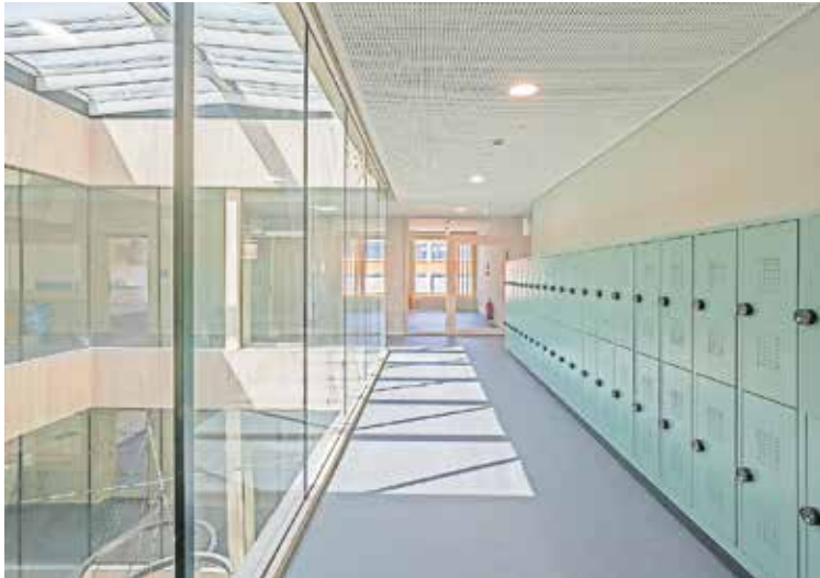
Blick in das Innere der Johannes-Helm-Schule

Für die „Architektouren 2026“ wurde unter anderem die Johannes Helm-Schule ausgewählt. Bei den „Architektouren“ handelt es sich um ein Wochenende der Offenen Tür, an dem Planende durch die von ihnen entworfenen Gebäude führen.