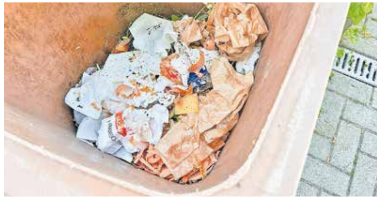
Papier bindet die Feuchtigkeit der Bioabfälle.

Zum Einwickeln von Bioabfällen eignen sich Zeitungspapier sowie Bäcker- oder Metzgerpapiertüten ohne Sichtfenster. Zudem sind im Handel kostengünstige Papiertüten erhältlich. Papier nimmt Feuchtigkeit auf und kann dadurch die Entwicklung von Maden deutlich reduzieren. Plastiktüten und Beutel aus Biokunststoff haben hingegen in der Biotonne nichts verloren.