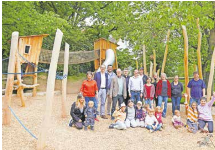
Freuten sich gemeinsam über den neuen Platz: Familien, Planer und Vertreterinnen und Vertreter der Stadt

Der Weg dorthin begann bereits im Frühjahr 2024 mit einer Beteiligung von Kindern und Familien aus der Nachbarschaft, die über die Gestaltung