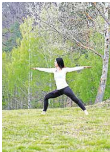
Yoga im Park entspannt

Ein besonderes Yoga-Event lädt zum Sommeranfang Frauen jeden Alters dazu ein, gemeinsam die warme Jahreszeit willkommen zu heißen. In entspannter Atmosphäre unter freiem Himmel erwartet die Teilnehmerinnen am Samstag, 20. Juni, ab 10 Uhr eine sanfte Yoga-Praxis, die keine Vorkenntnisse erfordert und den Frauen Raum für Begegnung, Bewegung und innere Balance schafft. Das Angebot ist kostenlos, Interessierte treffen sich am Stadtpark-Pavillon. Organisiert und durchgeführt wird