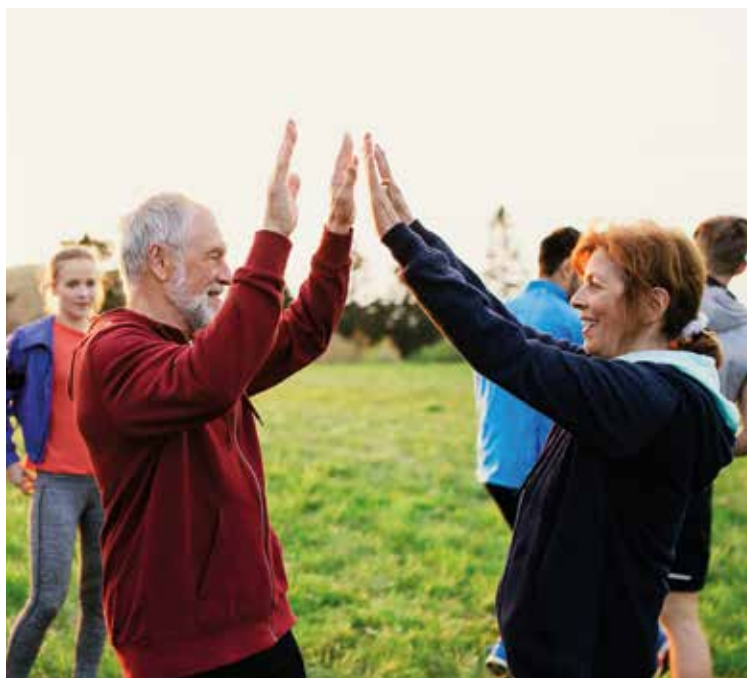
Bewegung im Freien und mit anderen macht mehr Spaß.

In Kooperation mit dem TV 1848 Schwabach erwartet die Teilnehmenden ein abwechslungsreiches Programm mit einfachen, alltagstauglichen Übungen. Diese fördern gezielt Kraft, Beweglichkeit und Ausdauer. Gleichzeitig entstehen wertvolle soziale Kontakte. Regelmäßige, moderate Bewegung stärkt das Wohlbefinden nachhaltig, beugt alltäglichen Beschwerden vor und verbessert die Lebensqualität spürbar.