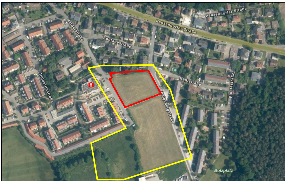
Abb. 2: Lage und Abgrenzung des Projektgebietes. Die rote Linie stellt die Flurstücke 1401 und 1401/2 der 1. Änderung zum Bebauungsplan S-92-98-Teil A dar. Gelb ist der Bewertungsraum dargestellt. Schematisch.